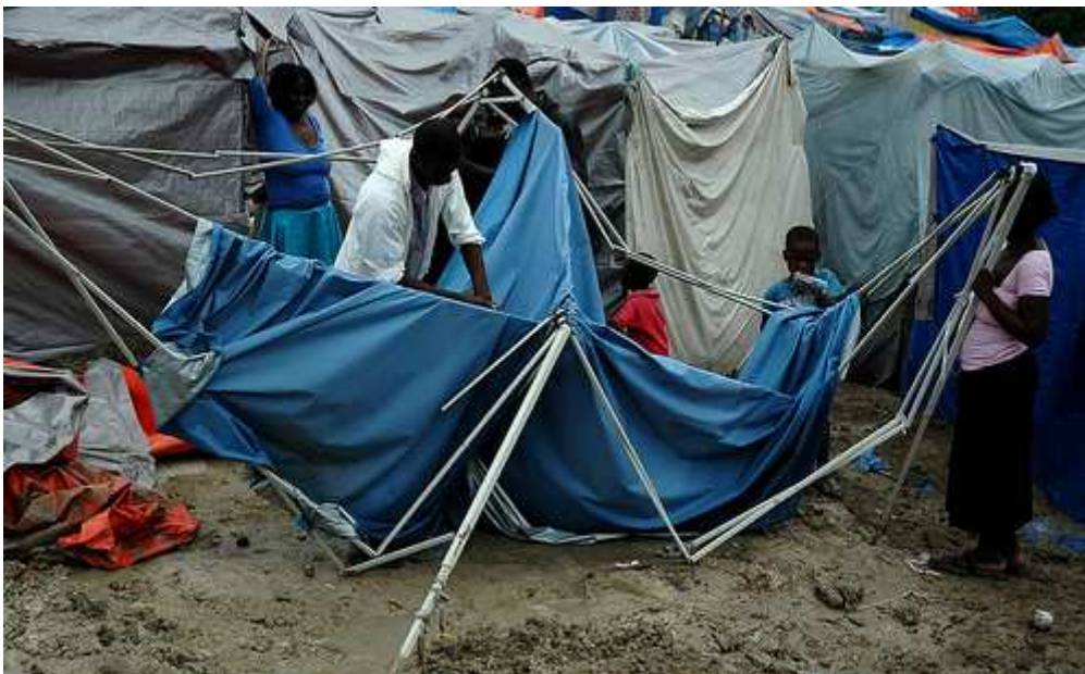
Instalación de una tienda de campaña distribuida por Cáritas en un campo de desplazados.

Cáritas quiere favorecer estos movimientos, que parten de un sentimiento popular de solidaridad y de unidad familiar, fuertemente arraigado en la sociedad haitiana. Cáritas Española está trabajando en la atención a estas personas en la provincia central de Haití, en la Diócesis de Hinche, donde han llegado miles de desplazados, a los que se les proporciona alimentos, artículos de higiene y materiales de construcción para ampliar y acondicionar las viviendas para que puedan acoger a un mayor número de personas.