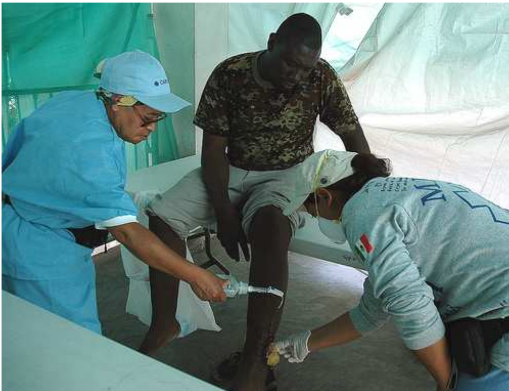
Un herido recibe atención médica en una de las clínicas temporales instaladas por Cáritas.

También existe una excelente coordinación con el PMA con el fin de evitar duplicaciones con la distribución de alimentos directamente con las Cáritas diocesanas.