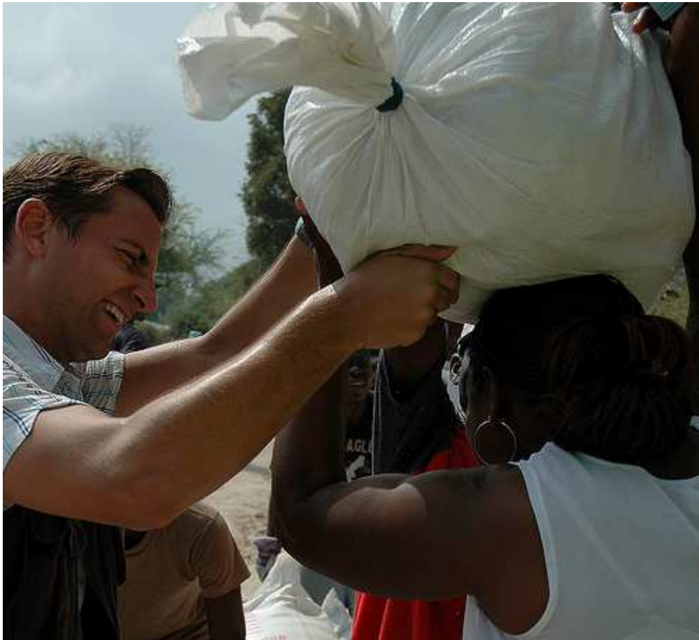
Operación de reparto de ayuda alimentaria.