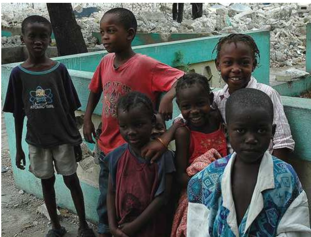
Los niños son uno de los gritos de atención prioritaria para Cáritas.