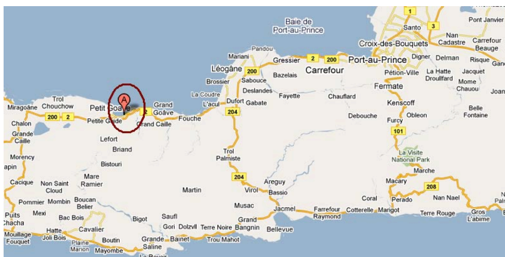
Mapa 1. Situación de la réplica

Por el momento no se han confirmado consecuencias significativas de este nuevo terremoto, que, según las primeras informaciones, no ha ocasionado víctimas.