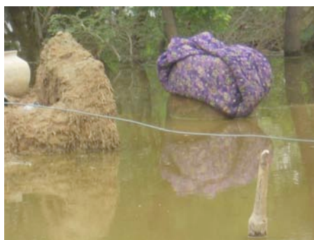
El Coordinador Nacional de C. Pakistán durante la evaluación de los daños y las necesidades y restos de una vivienda destruida bajo las aguas