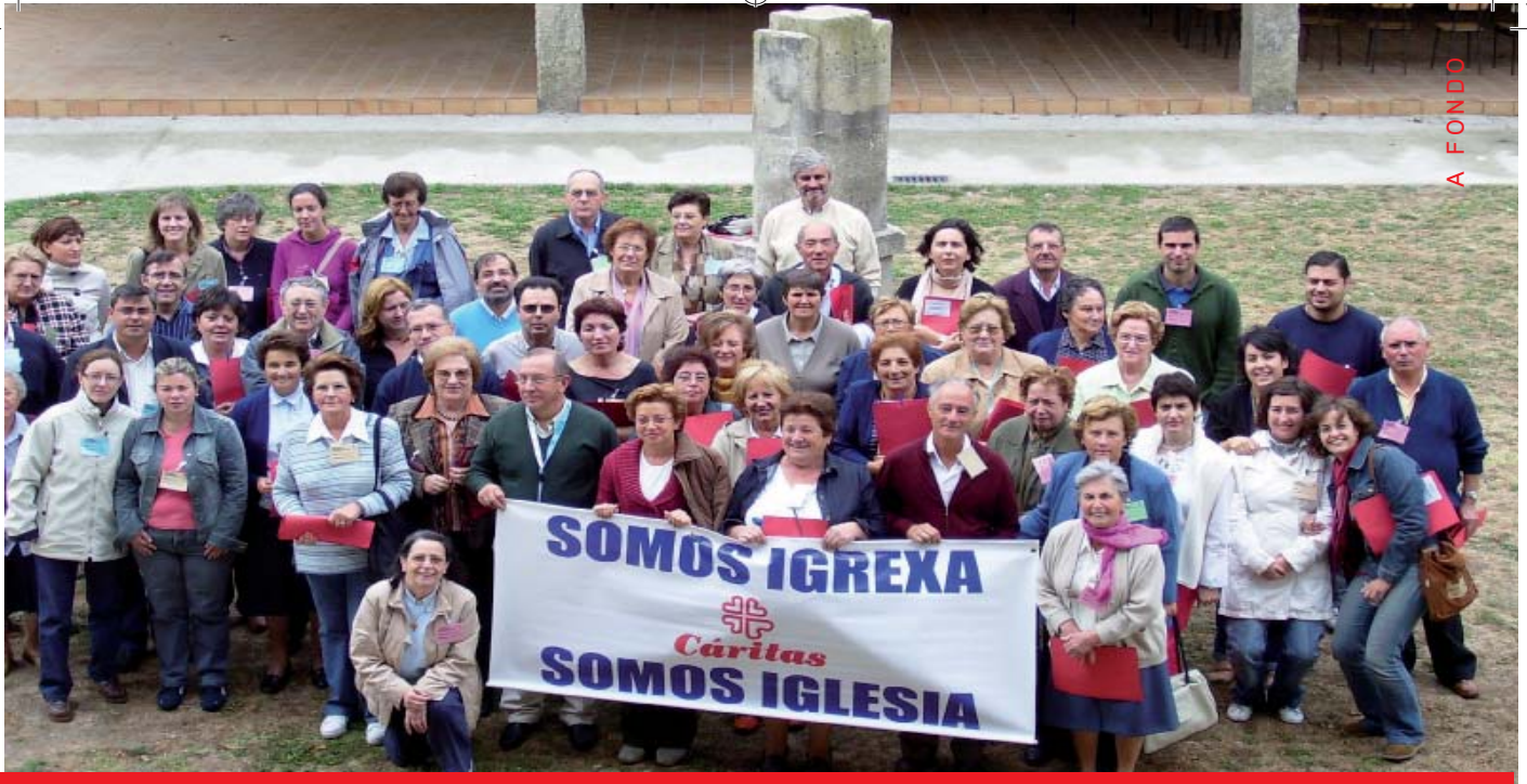
Asistentes a la Jornada de formación de voluntariado de Cáritas Diocesana de Tui-Vigo del año 2007.