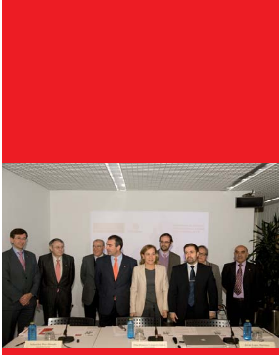
Responsables de Cáritas e da Fundación asinando a renovación.