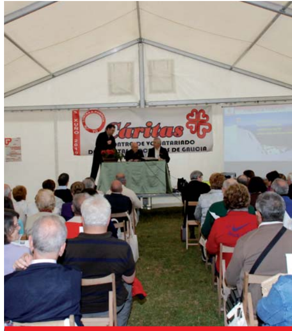
Imaxe do encontro de voluntariado das Cáritas galegas no ano 2010 en Santiago de Compostela.