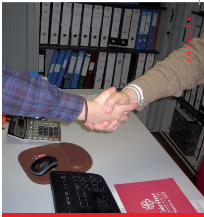
Detalle del Servicio de intermediación laboral

En primer lugar es importante destacar que la mayoría de las contrataciones realizadas a través