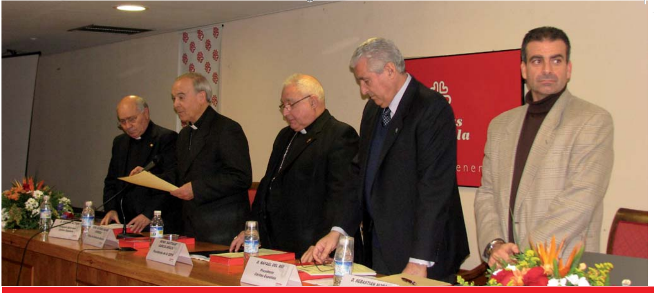
Unha das imaxes que deixou a Asemblea Xeral de Cáritas Española no Escorial en Xanerio deste ano.