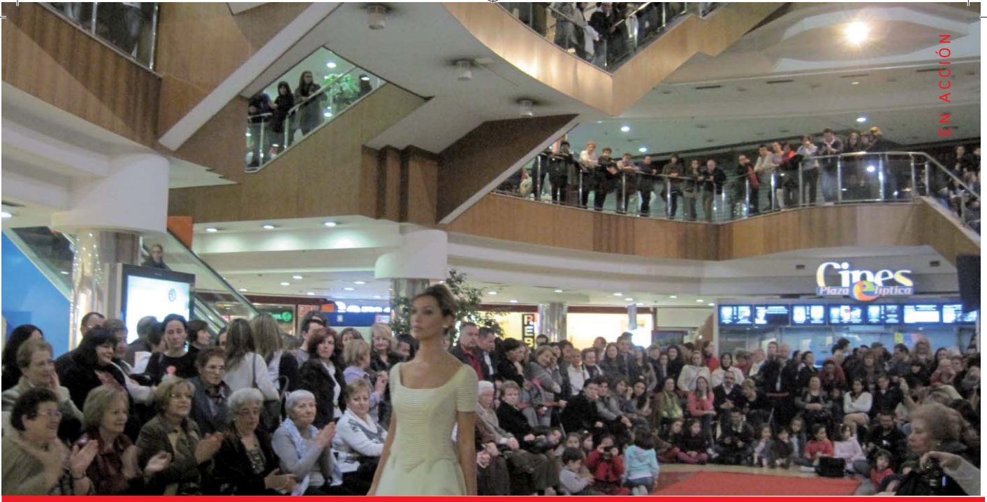
Imaxe do desfile inaugural do outlet de vestidos de noiva.