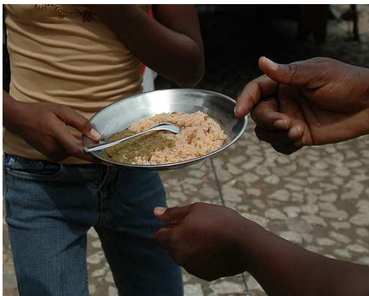
Distribución de comida por Cáritas Haití a menores no acompañados..

4. Asegurar las condiciones de salud e higiene en los campos de desplazados . Tras la fase de respuesta rápida, con una duración prevista de 2 meses, Cáritas comenzará la ejecución de una segunda fase de medio y largo plazo, en la que se contemplan actividades de apoyo durante 12 meses. Junto al mantenimiento de los objetivos señalados en los puntos anteriores, en esa etapa los esfuerzos se dirigirán a la rehabilitación y reconstrucción de hospitales, clínicas, escuelas e infraestructuras.