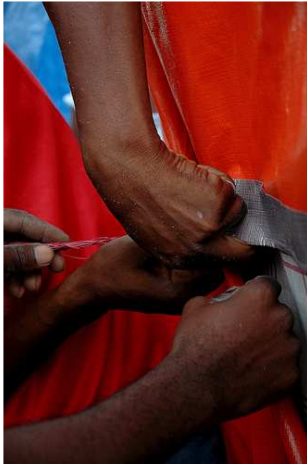
Dos damnificados instalan un refugio temporal.

Dentro de las líneas de actuación, los principales logros por capítulo de intervención son los que se detallan en los apartados siguientes.