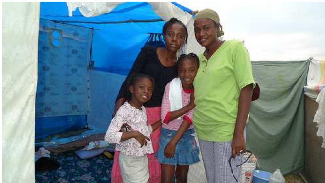
Una familia de damnificados junto a uno de los refugios temporales.