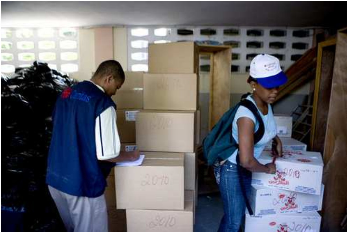
Dos trabajadores de Cáritas Haití revisan un envío de productos médicos recién llegados al almacén.