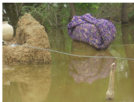
El Coordinador Nacional de C. Pakistan durante la evaluación de los daños y las necesidades y restos de una vivienda destruida bajo las aguas